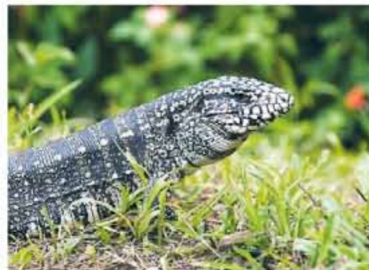
DGLER SEG PÅ Fryktinngytende og en ganske så nysgjerrig gjest.