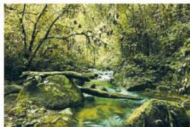
IKKE HVA DEN VAR Atlanterhavsregnskogen er kun syv prosent av hva den engang var.