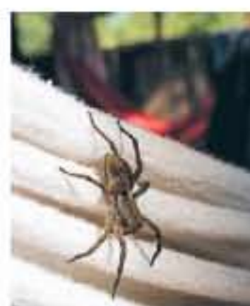
IKKE GOD Store edderkopper viser seg der man minst ønsker dem.