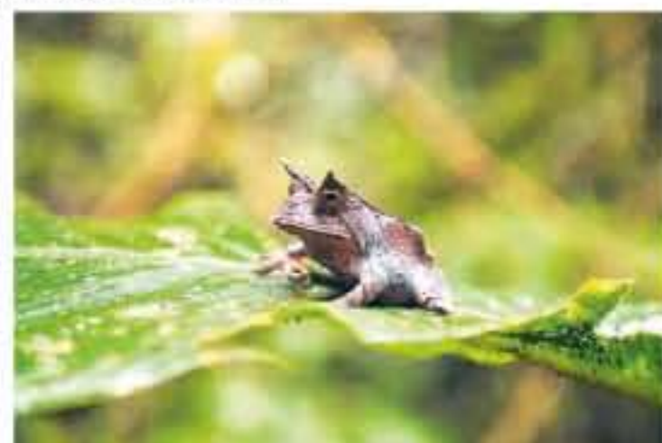
HISSIG En oksefrosk trives godt i det godt tempererte miljøet.