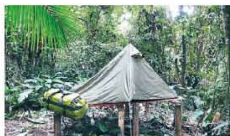
INNKVARTERING Telt på påler fungerte som Eeks rom i to uker.

Er du lei paraplydriker og grisevester kan jungelen være stedet. Men det anbefales med forbehold.